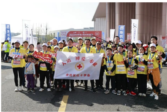
生命“髓”缘梦马跑团