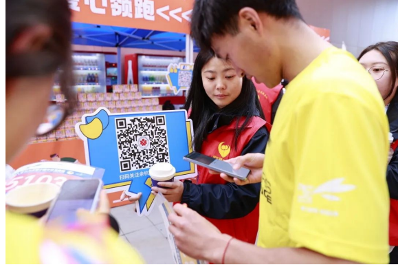
选手参加“余善同行·一块公益”活动