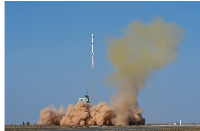
4月16日9时36分,我国在酒泉卫星发射中心使用长征四号乙运载火箭成功将风云三号07星发射升空,卫星顺利进入预定轨道,发射任务获得圆满成功。