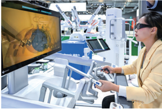
参会者在第七届进博会医疗器械及医药保健展区美敦力展台体验操作一款外科手术机器人

多。今年,50多个国家和地区的70多个境外商协会携1500多家中小企业组团参加进博会,其中不少是新参与组团。