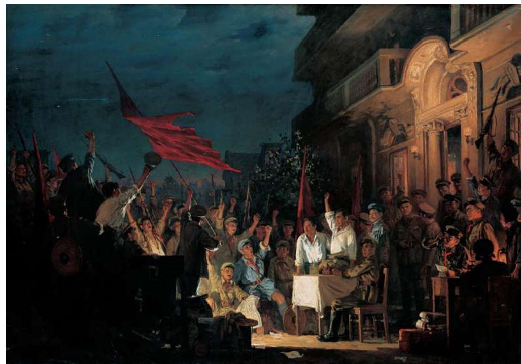
南昌起义,178×256cm,布面油画,1957年,中国人民革命军事博物馆藏