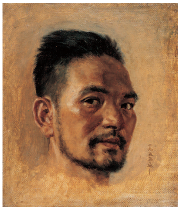
1955年自画像,35.5×28cm,纸板油画