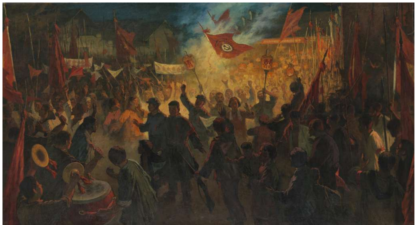
苏维埃万岁,158×258cm,布面油画,1964年,中国美术馆藏