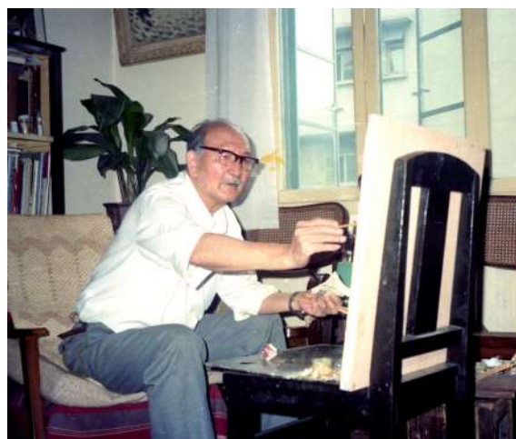
莫朴在家中作画,1990年

本报讯(通讯员 邹萍 记者 濮玉慧)由中共浙江省委宣传部、浙江省文化广电和旅游厅、中国美术学院指导,浙江美术馆主办的“朴直向阳——莫朴先生诞辰110周年艺术与文献展”近日亮相浙江美术馆。