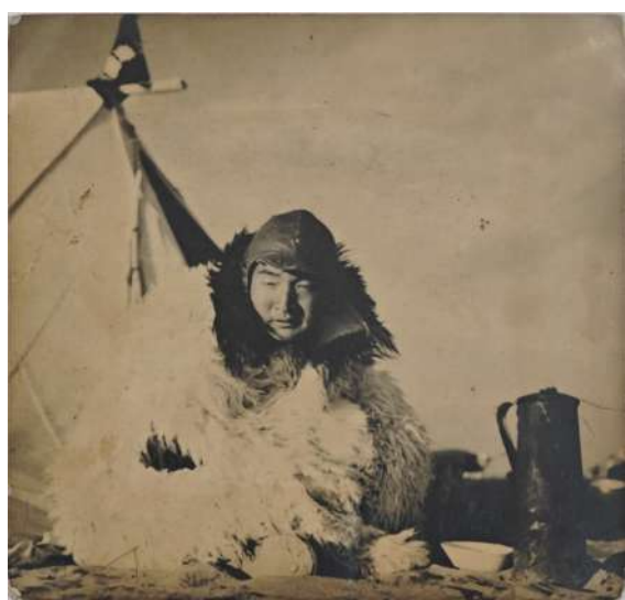
国难宣传团时期莫朴肖像,照片,16×15cm