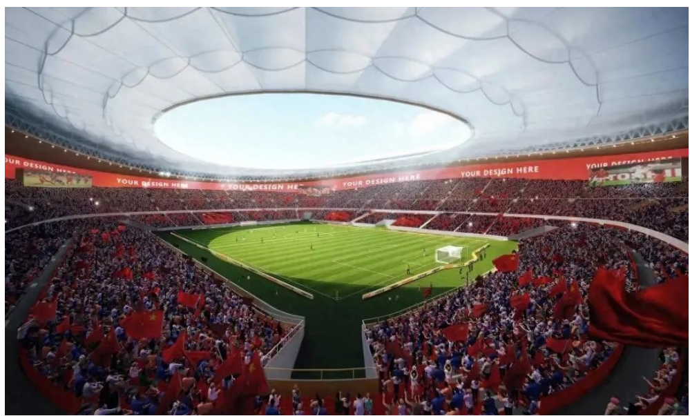
6万座专业足球场效果图

前已进入开工建设阶段。球场总建筑面积约30万平方米,高度61米,南北跨度超300米,东西跨度约270米,计划于2027年4月竣工,目前已完成场地平整、围挡、工程试桩等工作。