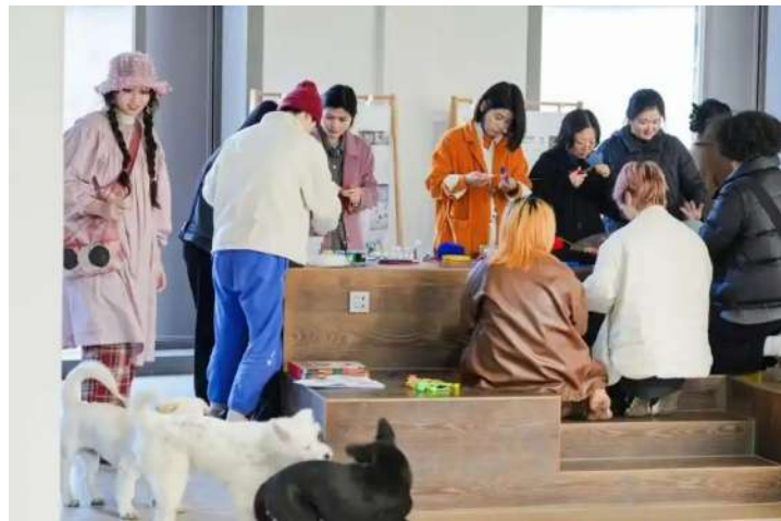
青山村共富工坊指导村民游客学习手工技艺