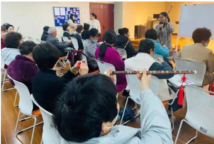
紫荆村为村民开展竹笛制作及电商直播培训